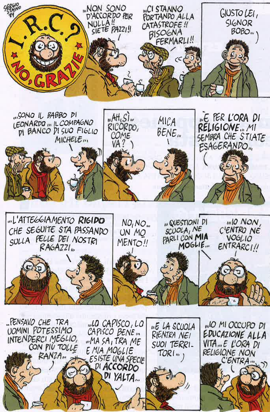
I dilemmi comunisti in una tavola realizzata da Sergio Staino (1940-2023) per un numero di Linus del 1989 sull'ora di religione