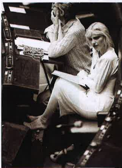
Ilona Staller, in arte Cicciolina, alla Camera: è stata deputata dal 1987 al 1992. Oggi ha 72 anni